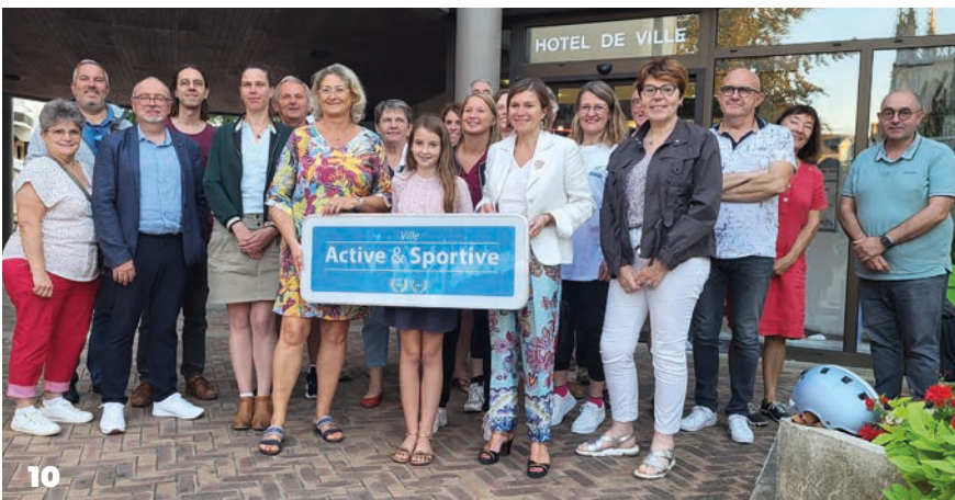
L'obtention du label « Ville Active & Sportive » (10).