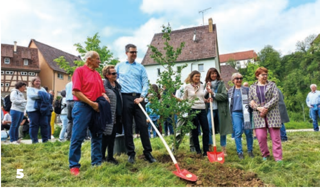
Les 50 ans du jumelage avec la ville d'Haigerloch (5).