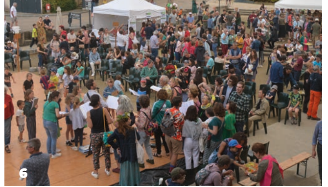
La rencontre culturelle 2023 : Le Rendez-fou ! (6).